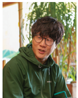
阿 そうですね。そこは意識しています。

阿 自分からボールを持った時に、近くの選手を見ていないから、自分の動きをもっと見てくれというのが言われていた。それとボールを出す位置を3年間ずっと言われていて、そこからすぐ前を見るようになったし、視野も広がったかなという印象です。