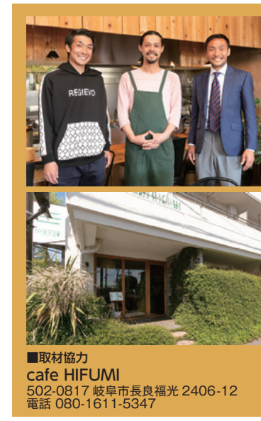
取材協力 cafe HIFUMI 502-0817 岐阜市長良福光 2406-12 電話 080-1611-5347